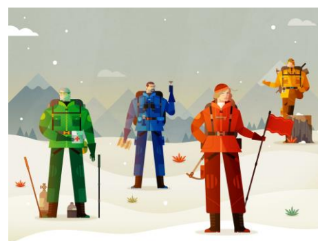
Libro juego "Subir Tal vez Bajar"

El taller está compuesto de un trabajo previo con la lectura de un libro juego "Subir, tal vez bajar", una jornada presencial y la realización de unos ejercicios individuales a través de la herramienta Mindmarker .